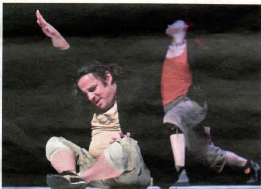
Une mise en scène sans naturalisme au service d'un texte à l'absurde inquiétant.

L'auteur est parti des études sur la soumission à l'autorité du chercheur Stanley Milgram, qui démontrait dans les années 60 que 62 % des gens n'hésiteraient pas à infliger sans raison, mais sur ordre, des souffrances dangereuses à leur prochain. Des études qui trouvèrent un écho inquiétant avec la diffusion, en mars 2010 sur France 2, de La Zone Extrême – 81 % d'obéissance... Sylvain Levey pousse les choses à l'extrême dans un jeu de télé-réalité sans titre, aux participants réduits à des numéros. Anne Lefèvre a réuni pour la circonstance la